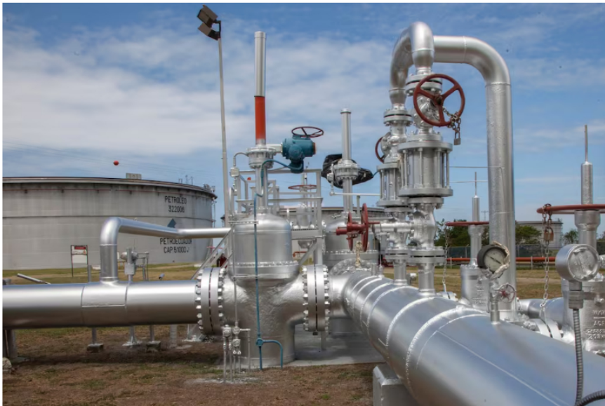
Instalaciones del SOTE de Petroecuador.