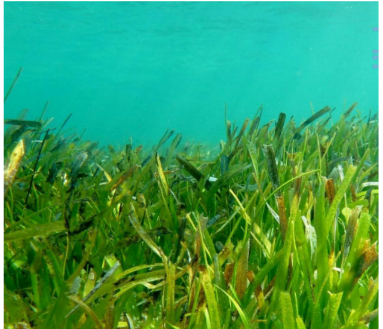
Ecopetrol e Invemar fortalecen su alianza para la investigación y conservación de los ecosistemas marino-costeros del Caribe colombiano, con énfasis en zonas estratégicas de La Guajira.