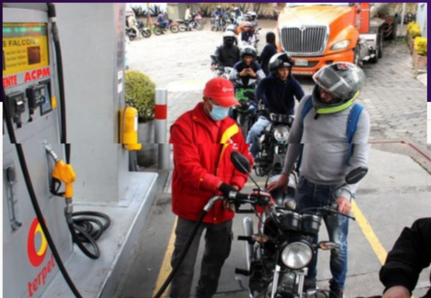
Estación de servicio de gasolina

La petrolera mantiene una diferencia de interpretación normativa y anunció acciones legales para controvertir la decisión de la Dian.