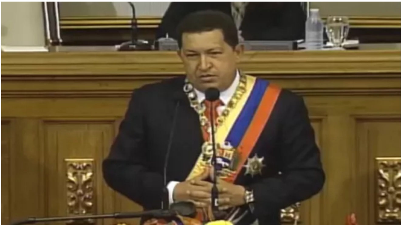
Entre la indecisión y la ruptura: así votaron los venezolanos cuando Hugo Chávez llegó por primera vez al poder