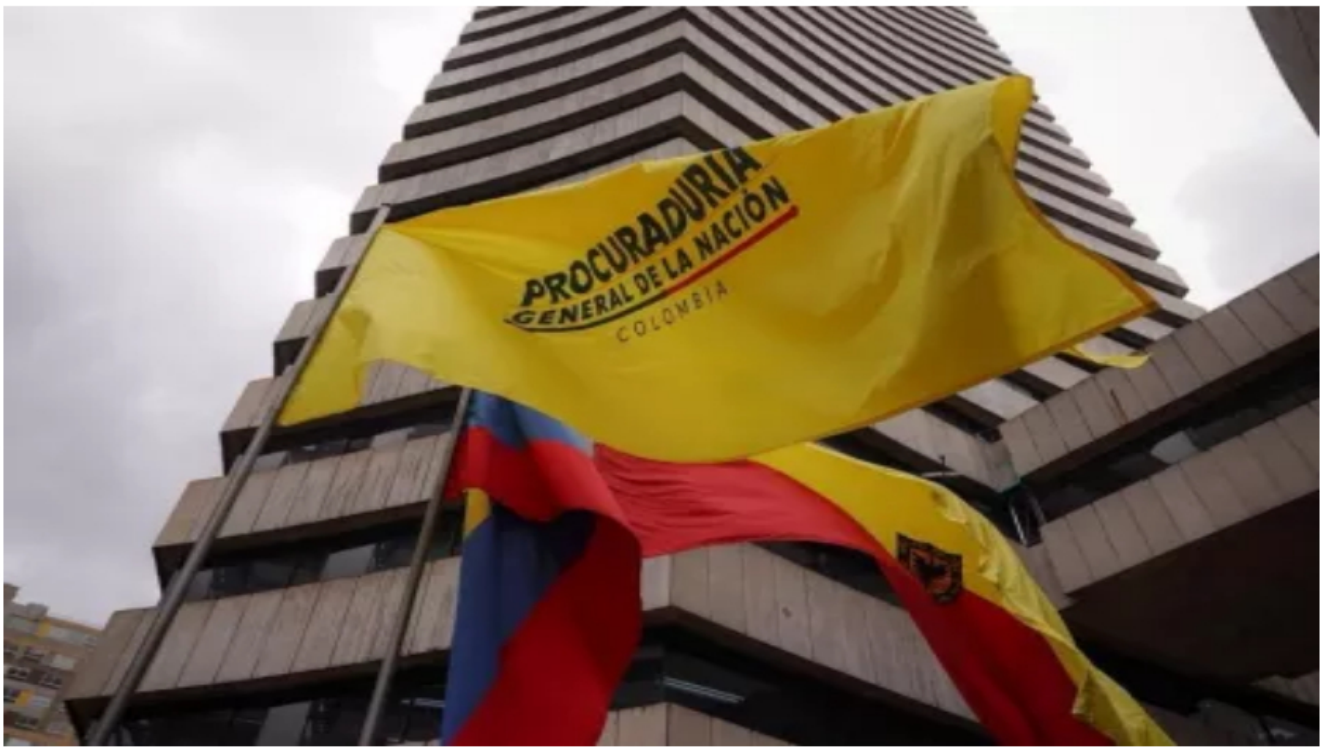
Procuraduría reitera prohibición de contratar en año electoral tras decreto del MinTrabajo