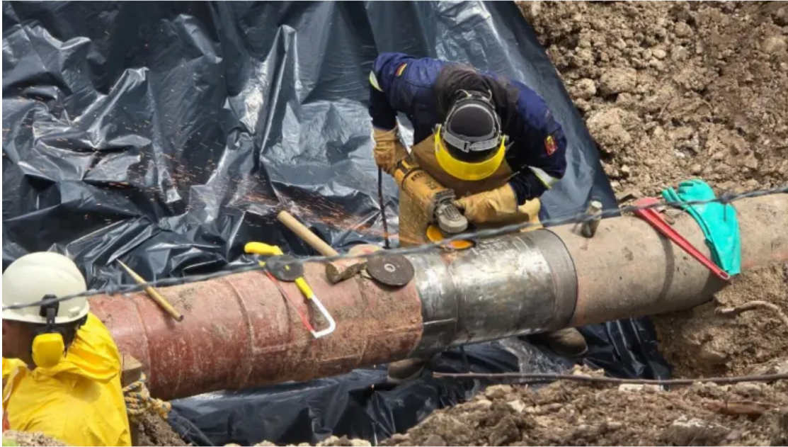
Válvulas ilegales para extracción de hidrocarburos.

El derrame de combustible se produjo en la vereda Tenerife, zona rural del municipio de Barrancabermeja.