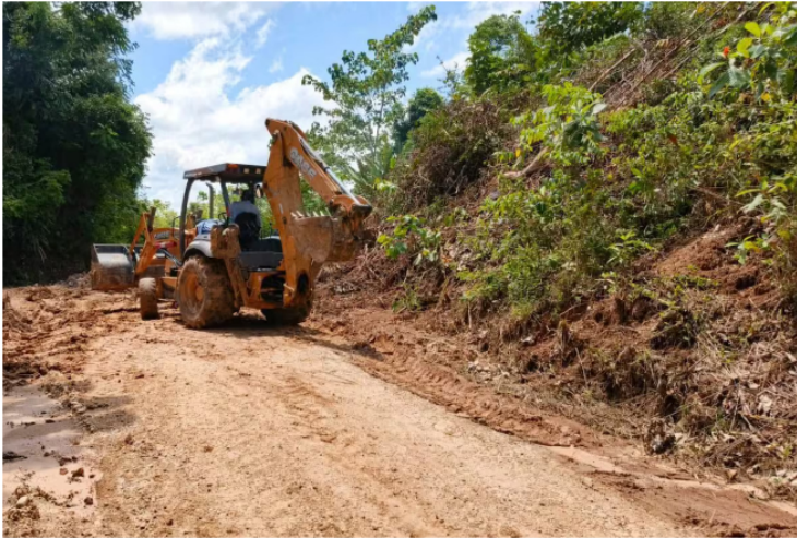
Ecopetrol socializó con la comunidad el proyecto para la pavimentación de 9,4 kilómetros de vías terciarias en Yondó.

Compartir Publicado por: Lesly Adriana Cifuentes