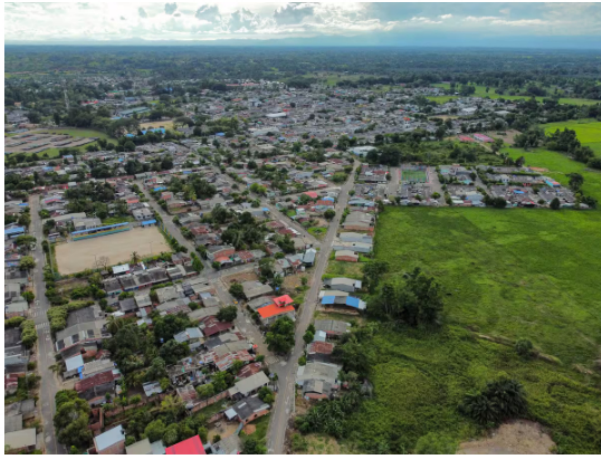
Ecopetrol socializó con la comunidad el proyecto para la pavimentación de 9,4 kilómetros de vías terciarias en Yondó.

Adicionalmente, se implementarán planes de manejo de tránsito y de gestión ambiental, junto con señalización vial, con el fin de asegurar condiciones adecuadas de seguridad, sostenibilidad y protección del entorno durante la ejecución y operación de la obra, según informó la compañía.