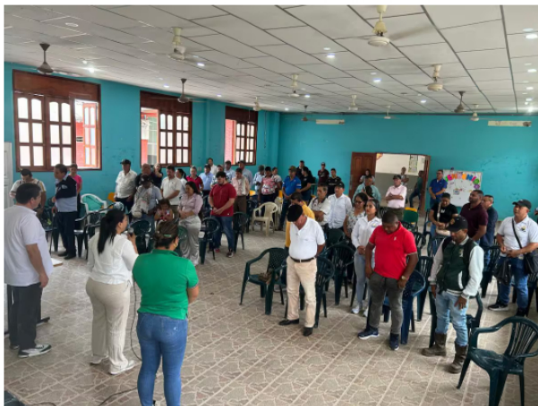
Ecopetrol socializó con la comunidad el proyecto para la pavimentación de 9,4

La socialización del proyecto se realizó con la participación de la Alcaldía de Yondó, el equipo de Gestión Territorial de Ecopetrol , el Instituto Nacional de Vías (Invias), el consorcio constructor, la firma interventora y representantes de las comunidades, quienes conocieron el alcance técnico, social y ambiental de la iniciativa.