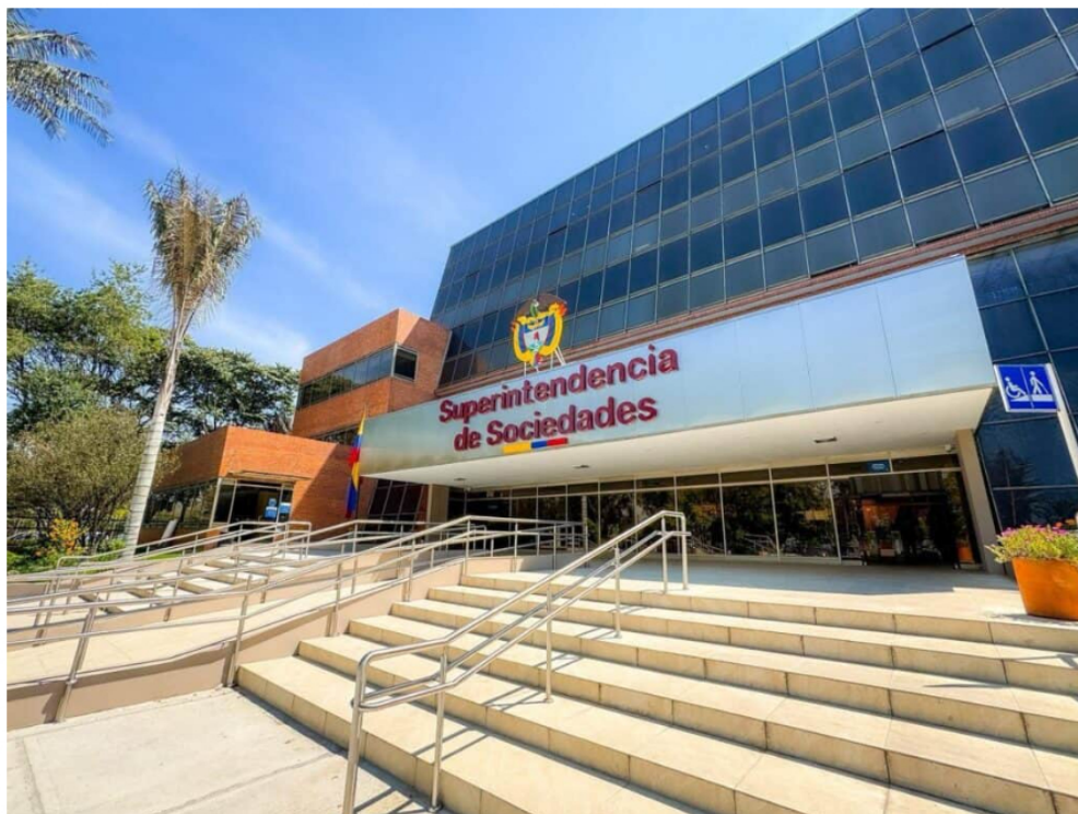
Superintendencia de Sociedades.

No, de la valoración no, porque esa parte no la hacemos nosotros. Sabemos que está que están cumpliendo con las exigencias de la norma en términos de sus estados financieros y demás.