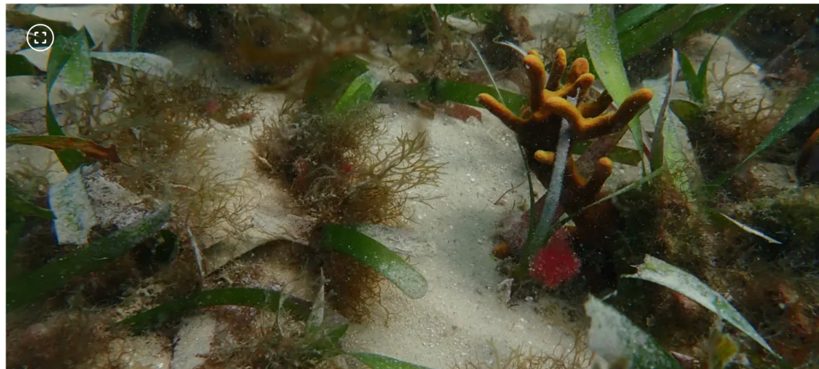
Ecopetrol e Invemar firmaron nuevo acuerdo para estudiar y proteger ecosistemas del Caribe colombiano

El informe dio a conocer las pérdidas y ganancias en las coberturas de manglar entre los años 2016 y 2025.