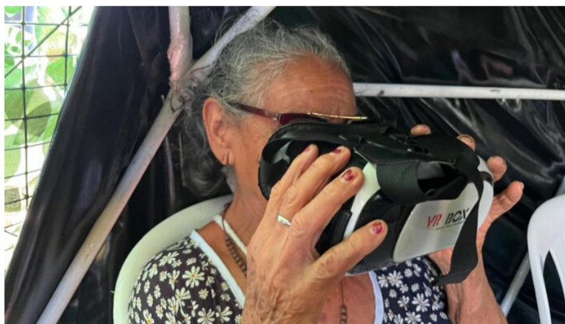
La atención médica también fue oftalmológica en zonas de difícil acceso.

En materia de servicios públicos, 3 mil familias accedieron al programa Gas Social , desarrollado en convenio con la gobernación de La Guajira, como una alternativa para mejorar las condiciones de vida de las comunidades.