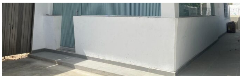
La Casa de Asuntos Indígenas de Uribia fue adecuada y dotada para fortalecer la atención y el tejido social de la comunidad wayuu.

De manera complementaria, cerca de 5 mil niños de 31 unidades de servicio del Instituto Colombiano de Bienestar Familiar (Icbf) accedieron a programas orientados a la atención integral de la primera infancia. En educación superior, cinco jóvenes guajiros hicieron parte del grupo de 100 nuevos beneficiarios del programa Bachilleres Ecopetrol 2025 .