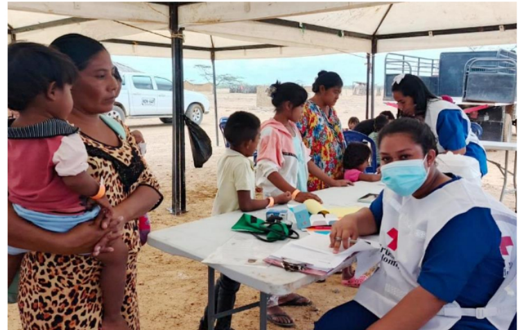
Brigadas de salud recorrieron 146 comunidades del departamento, llevando atención médica y odontológica a zonas de difícil acceso.