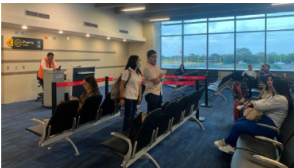
Avianca le pide al Congreso aprobar proyecto para endurecer sanciones a pasajeros disruptivos