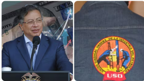
La USO el mayor sindicato de Ecopetrol le insiste al presidente Petro que no venda el Permian.