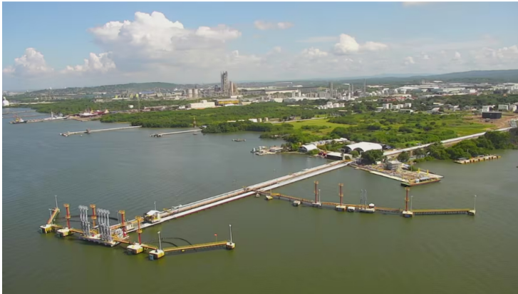
Instalaciones portuarias de Ecopetrol en la bahía de Cartagena, con concesión a cargo de la ANL.

La Contraloría concluyó que hubo gestión fiscal irregular, así como fallas en la planeación, gestión y supervisión por parte del ministerio y de Ecopetrol. Los recursos invertidos, afirmó, no cumplen su propósito, no prestan ningún servicio y tampoco generan beneficios para la comunidad raizal.