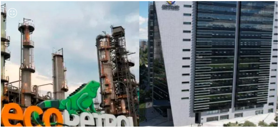
Contraloría detectó más de 86.000 millones de pesos en irregularidades en la contratación de Ecopetrol

Uno de los proyectos con mayor riesgo fiscal es el Ecoparque Solar Providencia, cuya inoperancia se tasó en $49.592 millones en posibles pérdidas.