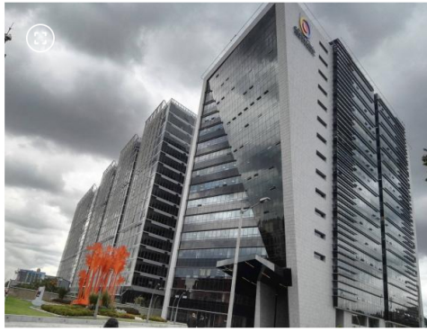
Contraloría General de la Nación

Este proyecto fue suscrito para atender la emergencia humanitaria tras la devastación del huracán Iota, en noviembre de 2020, y como parte de la estrategia nacional de transición energética.