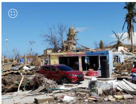
El centro de Providencia lucía así, tras el paso del huracán Iota.

El otro contrato que derivó en un posible daño fiscal fue el No. 3050857, suscrito entre Ecopetrol y la empresa Morelco S.A.S. El presunto detrimento se tasó en $36.000 millones, correspondientes a la suma asegurada que no logró recuperarse – la aseguradora no los desembolsó – por fallas en la gestión de Ecopetrol para activar oportunamente las cláusulas de incumplimiento.