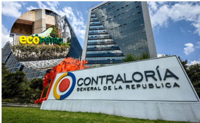
La Contraloría General de la República identificó hallazgos fiscales por $86.054 millones en dos contratos de Ecopetrol

La Contraloría estableció que la petrolera no logró recuperar $36.462 millones al no aplicar de manera oportuna las medidas previstas ante incumplimientos con la empresa Morelco S.A.S.