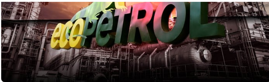
Fotoilustración: Yamith Mariño Díaz