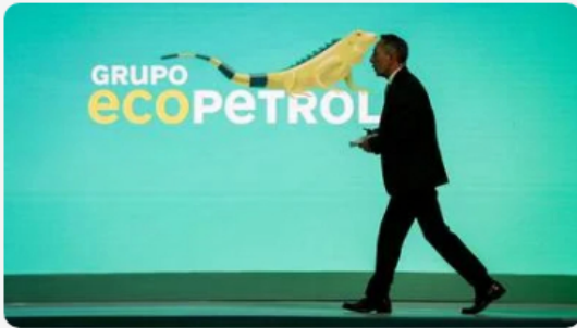
El presidente de Ecopetrol , Ricardo Roa, caminando en las oficinas de la petrolera estatal.

PODER • Publicado el 19 de enero de 2026 a las 6:50 pm ⓘ