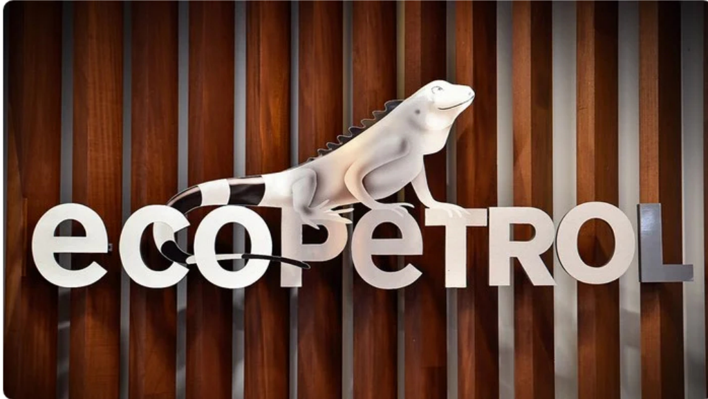
Logo de Ecopetrol , la empresa estatal de hidrocarburos.

En la práctica, según la Contraloría General de la República, ese objetivo nunca se materializó. El resultado de la auditoría realizada durante la vigencia 2024 fue un hallazgo fiscal por 49.592 millones, asociado a este proyecto que, pese a estar construido, no presta el servicio completo y permanece expuesto al deterioro ambiental.