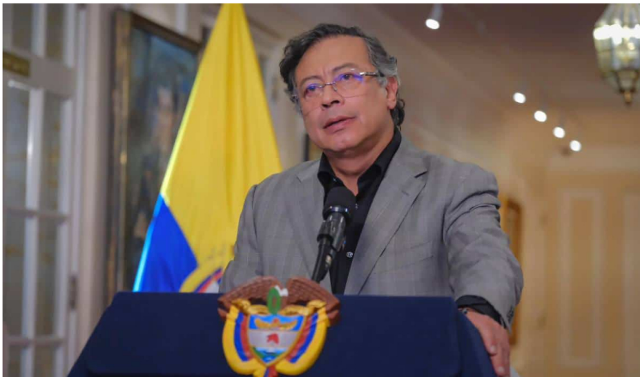
Gustavo Petro, presidente de Colombia.

Ahora lo que falta es que se complete la lista para llevar la propuesta a la asamblea de accionistas en marzo. Según Acosta, las fichas que hay en la baraja no son cercanas al presidente Petro , por lo que no le será fácil alinearlas.