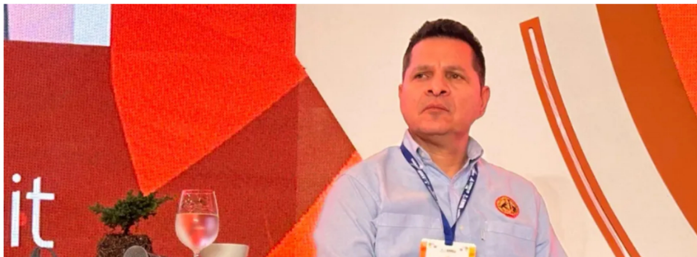
Foto: Loza Arenas, además de presidir la USO, es trabajador de carrera en Ecopetrol. / Prensa Unión Sindical Obrera.