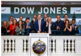
Wall Street: el 'efecto Maduro' dispara el apetito inversionista en Colombia