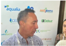
Ecopetrol asume el 100% de los bloques de gas en el Caribe tras salida de Shell