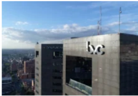
Las acciones que más subieron en la Bolsa de Valores de Colombia durante 2025