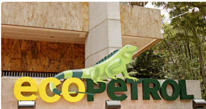
La elección de Loza es una decisión histórica para la compañía.

“Las trabajadoras y los trabajadores me han otorgado el honor y la gran responsabilidad de representarlos en la Junta Directiva de Ecopetrol ”, comentó Loza a través de su cuenta oficial en X.