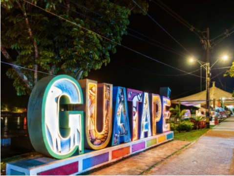
Colombia lidera el turismo suramericano: visitantes se disparan 138% con inversión billonaria