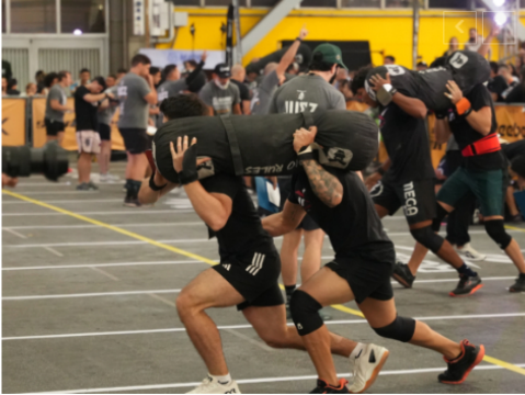
ExpoFitness llega con todo este 2026