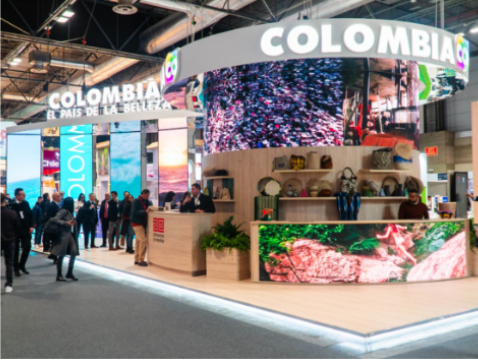
Colombia lanza su mayor ofensiva turística: lleva delegación récord a FITUR 2026