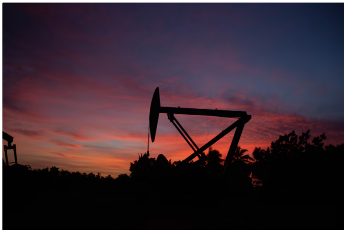
Extracción del crudo

Durante 2023 y 2024, el Gobierno mantuvo un plan de pagos para reducir estos saldos, que en su momento alcanzaron niveles históricos. La meta era disminuir gradualmente el déficit del fondo, proceso que, de acuerdo con Ecopetrol, ha tenido un avance significativo gracias al cumplimiento de los giros programados.