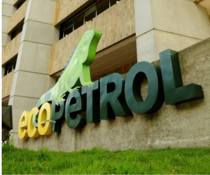
Ecopetrol sede en Bogotá

La petrolera señaló que el comportamiento reciente del mercado internacional ha permitido reducir parcialmente la presión sobre el fondo, pero advirtió que la volatilidad persiste, por lo que se requiere una estrategia de mediano y largo plazo para evitar que se acumulen déficits de gran magnitud.