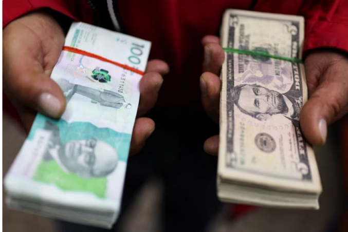
FOTO DE ARCHIVO: Un empleado muestra un billete de cien mil pesos colombianos y uno de cinco dólares estadounidenses en una casa de cambio, en Bogotá., Colombia Enero 27, 2025. REUTERS/Luisa González

Según explicó la empresa, el déficit que experimentó el fondo en los años 2021 y 2022 estuvo vinculado principalmente a la brecha entre las tarifas internas y las internacionales, las cuales aumentaron por diferentes razones.