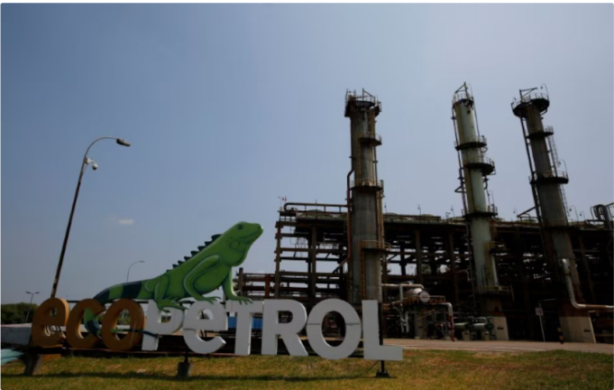
Sindicatos denunciaron que la votación se adelantó, limitando la deliberación de los trabajadores

Organizaciones sindicales han señalado que la fecha de la votación se adelantó, lo que habría limitado la deliberación de los trabajadores sobre quién es el más adecuado para el cargo. Argumentan que los primeros días de enero corresponden a un período vacacional, pero la votación se programó para el 15 de enero.