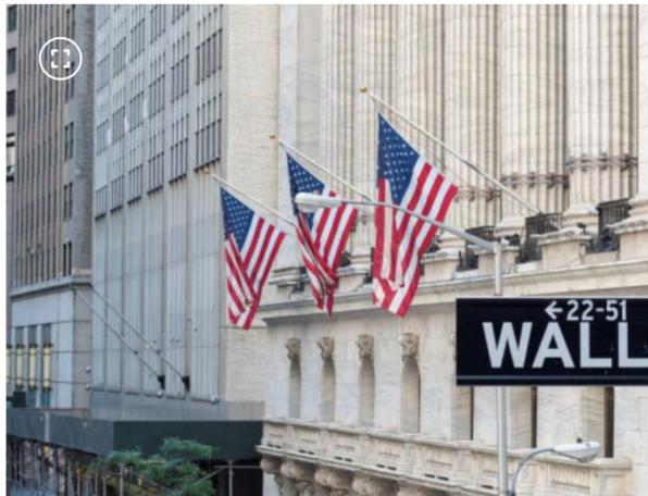
Wall Street

Según informó la compañía, la decisión se tomó luego de evaluar la positiva acogida que la reducción de costos ha tenido en el mercado desde su implementación, así como el impacto favorable en el menor costo transaccional para los accionistas.