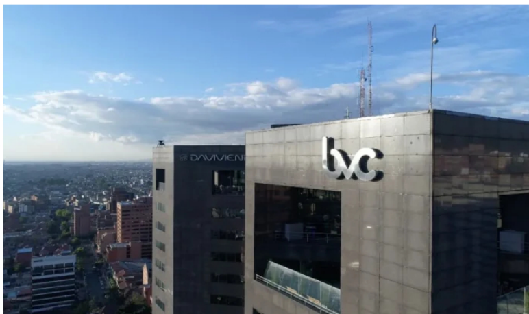
Sede Bolsa de Valores de Colombia (BVC).

Así le fue al mercado bursátil colombiano en 2025 , cuánto subieron las acciones y en cuánto cerraron en la Bolsa de Valores de Colombia (bvc). Las acciones de Mineros , con un incremento del 259,6%, y Nutresa , con el 257%, se consolidaron como los activos más rentables del periodo.