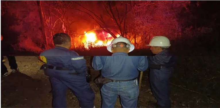
Blu Radio. Atención incendio en línea de hidrocarburos de Cenit

La compañía filial de Grupo Ecopetrol activó un Plan de Emergencia y Contingencia (PEC) del Polioriente por el incendio en Puente Nacional, Santander.