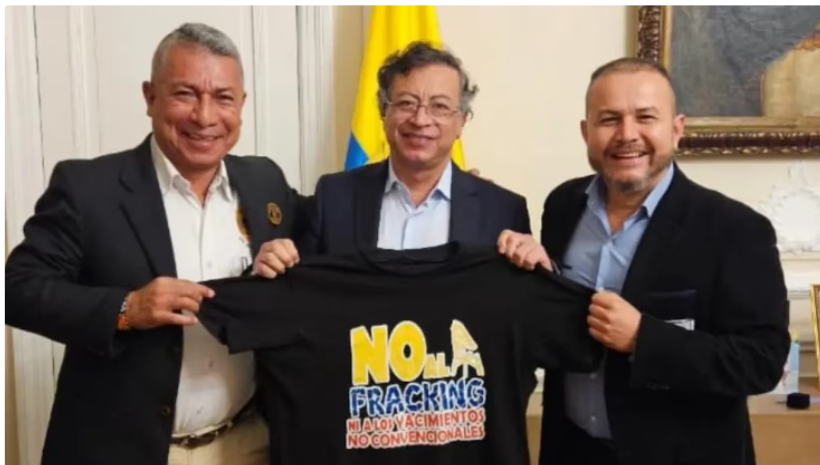
Gustavo Petro reiteró su rechazo al fracking en Colombia, al insistir en que la protección del agua debe estar por encima de cualquier proyecto de explotación de hidrocarburos en el país

Gustavo Petro cuestionó el uso del fracking y los negocios asociados a Ecopetrol, al señalar que han afectado sus recursos de inversión.