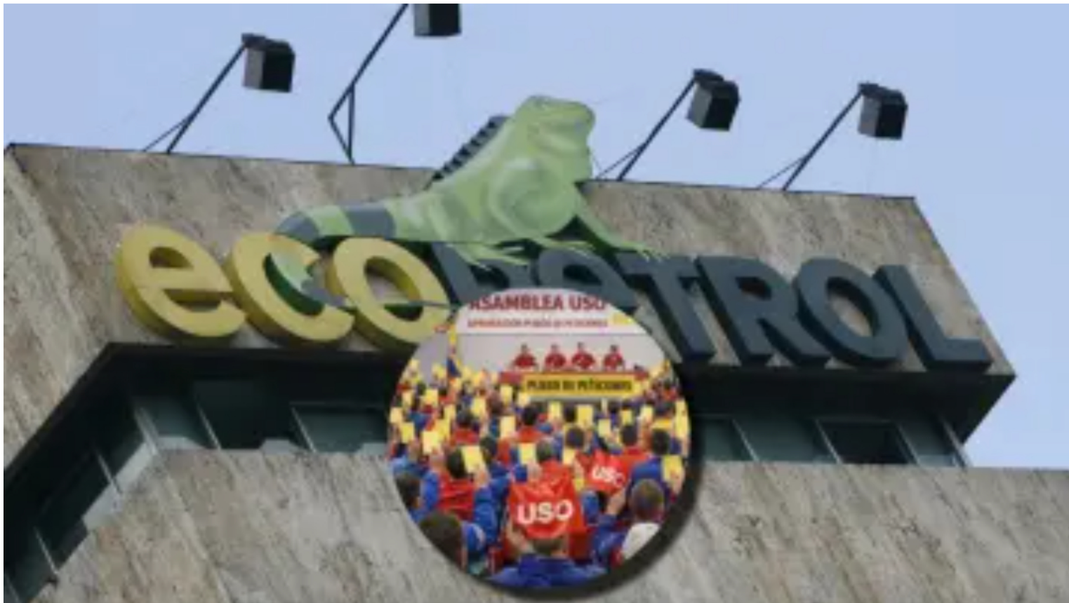
Ecopetrol , USO.

El sindicato petrolero busca que MinHacienda y Ecopetrol rindan cuentas sobre un plan de desinversión que pondría en riesgo la soberanía energética y el patrimonio público del país.