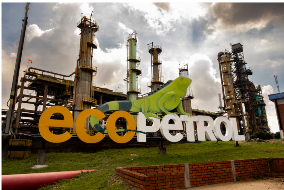
Letrero de Ecopetrol en la entrada de la planta de procesamiento de diésel en la refinería de Barrancabermeja, en Barrancabermeja, departamento de Santander, Colombia.

La deuda total ha alcanzado US$27.000 millones, con presión adicional derivada de políticas fiscales y de dividendos, en un entorno donde “un perfil persistentemente negativo de flujo de caja libre neto, impulsado por una elevada carga de impuestos y dividendos, así como un aumento del gasto de capital, ha afectado el apalancamiento y las métricas crediticias de Ecopetrol ”.