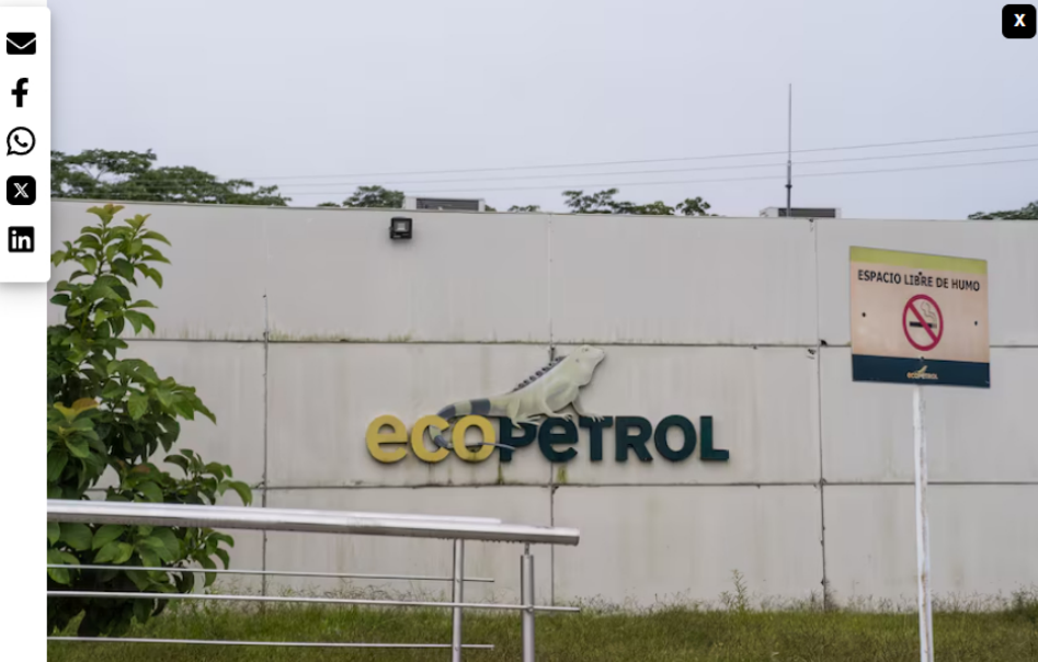
Elecciones en Colombia comienzan a desafiar la negociación de bonos de Ecopetrol . En la imagen, las oficinas administrativas de la planta de producción petrolera Ecopetrol SA Castilla 3 en Castilla la Nueva, departamento del Meta.

Los bonos acumulan retornos superiores a sus pares en 2026, pero el resultado electoral podría redefinir estrategia, flujo de caja y percepción de riesgo.