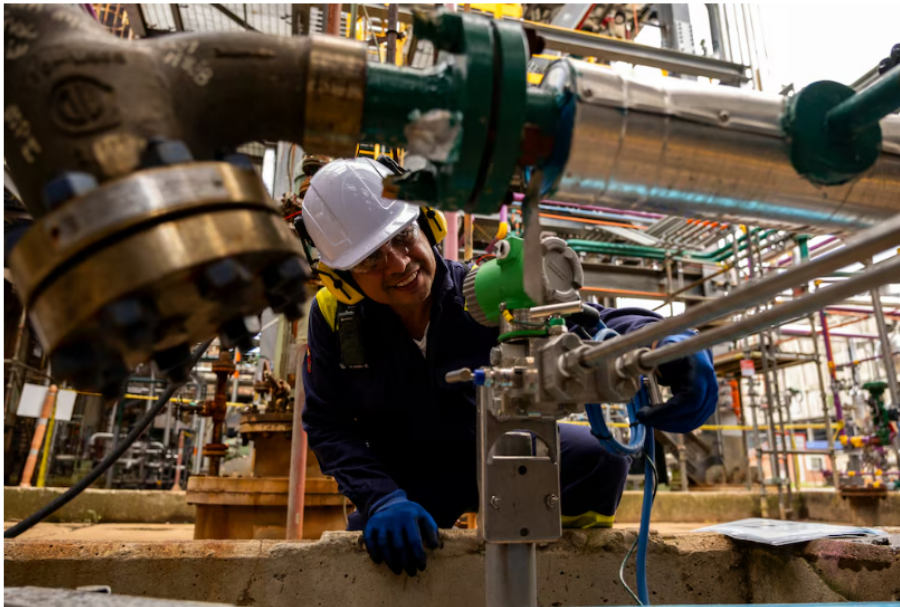
Un trabajador realiza tareas de mantenimiento general en la planta de procesamiento de gasolina y diésel de la refinería Ecopetrol Barrancabermeja, en Barrancabermeja, departamento de Santander, Colombia.