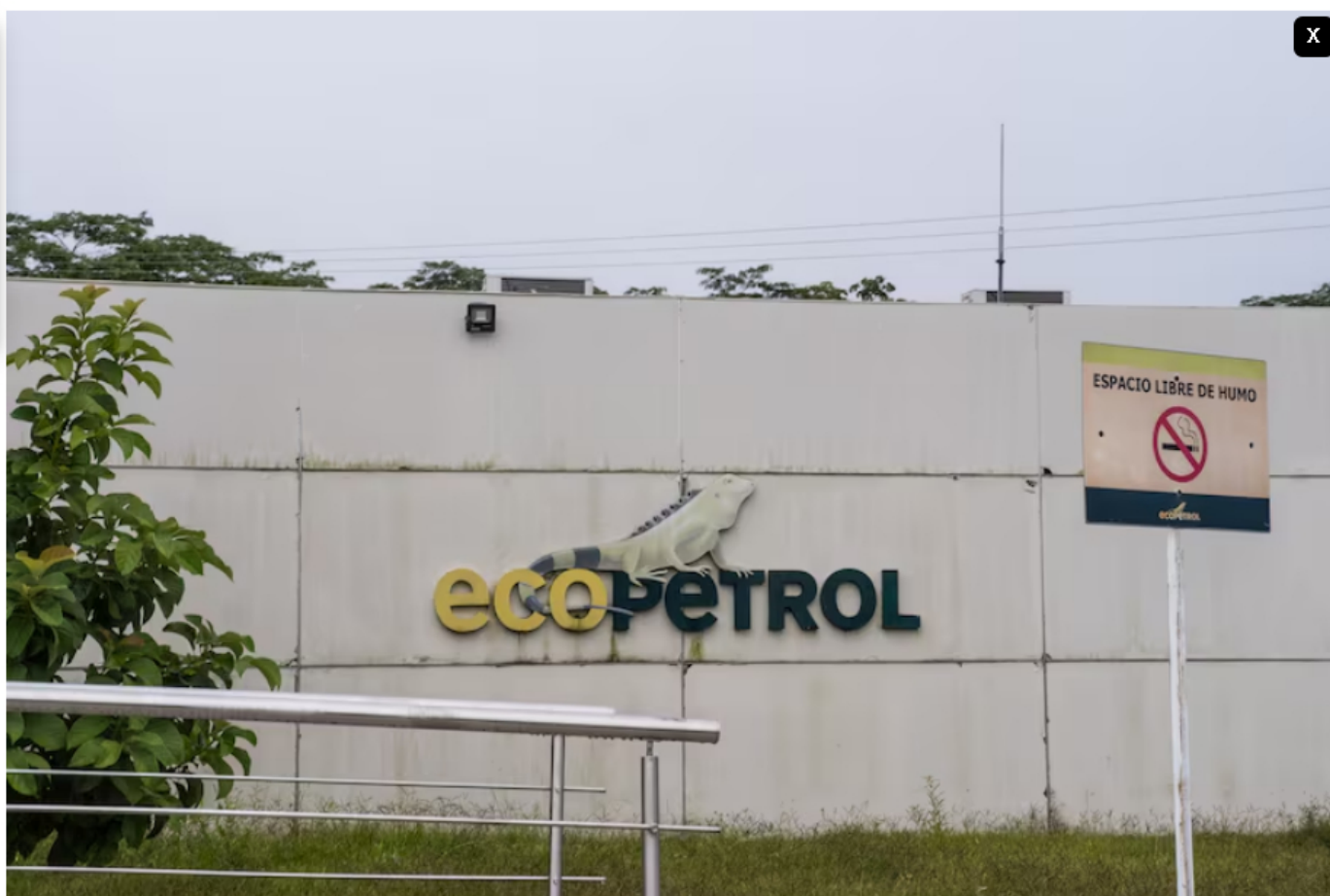
Elecciones en Colombia comienzan a desafiar la negociación de bonos de Ecopetrol . En la imagen, las oficinas administrativas de la planta de producción petrolera Ecopetrol SA Castilla 3 en Castilla la Nueva, departamento del Meta.

Por Carlos Rodríguez Salcedo | 29 de abril, 2026 | 04:00 AM