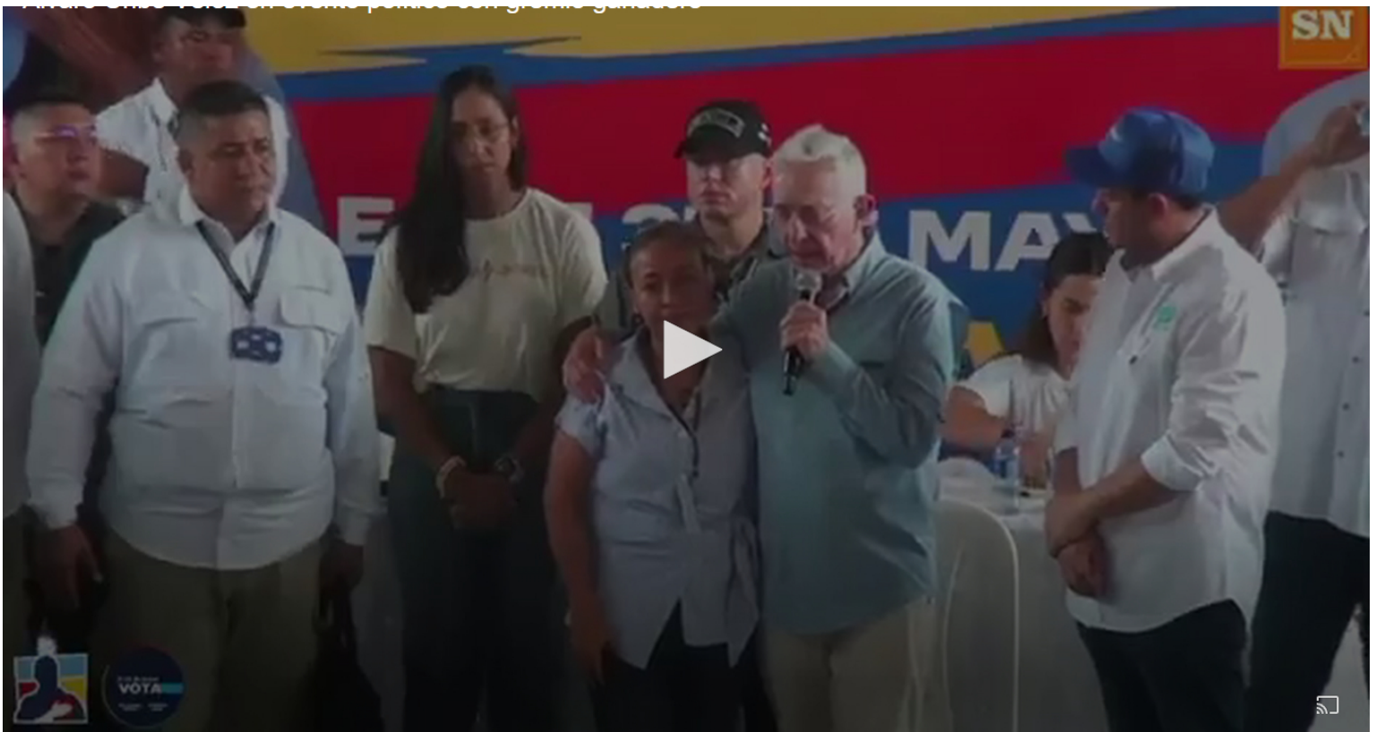
Álvaro Uribe Vélez en Aguachica, donde envió un mensaje al sector ganadero y criticó al Gobierno nacional y a Iván Cepeda

También reiteró su respaldo a la candidatura de Paloma Valencia, en un escenario electoral que, según el propio Centro Democrático, representa un desafío importante en la región Caribe, donde otras figuras políticas han ganado terreno.