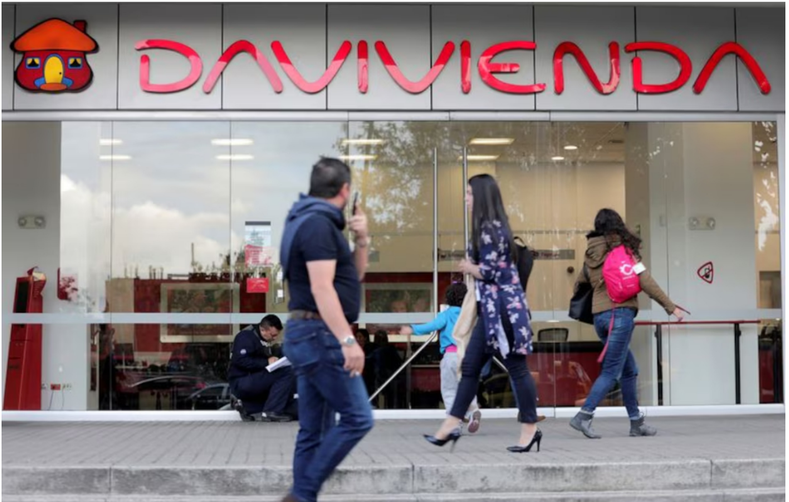
El período de gracia a capital otorgado por Davivienda será de cinco años

La resolución se expidió luego de la revisión del concepto favorable emitido por la Subdirección de Financiamiento de Otras Entidades, Seguimiento, Saneamiento y Cartera de la Dirección General de Crédito Público y Tesoro Nacional, así como el análisis de la minuta del contrato de empréstito interno y pagaré que proyecta celebrar la empresa con el banco.