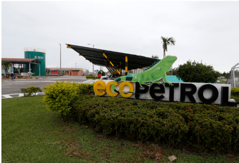
Ecopetrol es la empresa más grande y rentable del Estado colombiano

El Gobierno de Gustavo Petro presentó ante el Congreso de la República el Plan de Enajenación 2026. Este contempla la posible venta de activos estatales clave valorados en más de $50 billones. Destacan empresas del sector energético, como Ecopetrol y sus principales filiales, lo que abriría la puerta a desinversiones inéditas en el país.