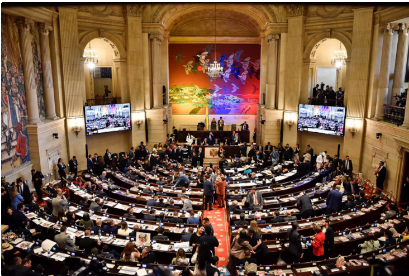
El Congreso de la República será clave para el desarrollo del Plan de Enajenación