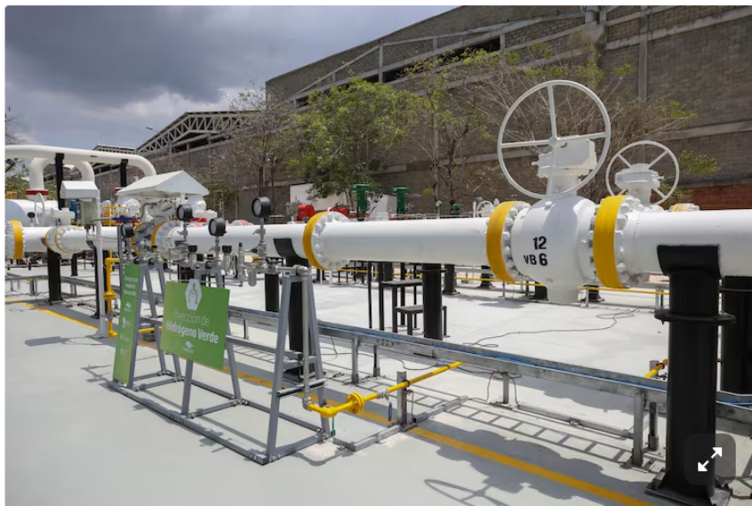
Ecopetrol y un plan para 2034.

De acuerdo con voceros de la compañía, esta iniciativa representa la apertura de una nueva línea de negocio dentro del segmento de refinación , lo que amplía significativamente el potencial comercial del producto.