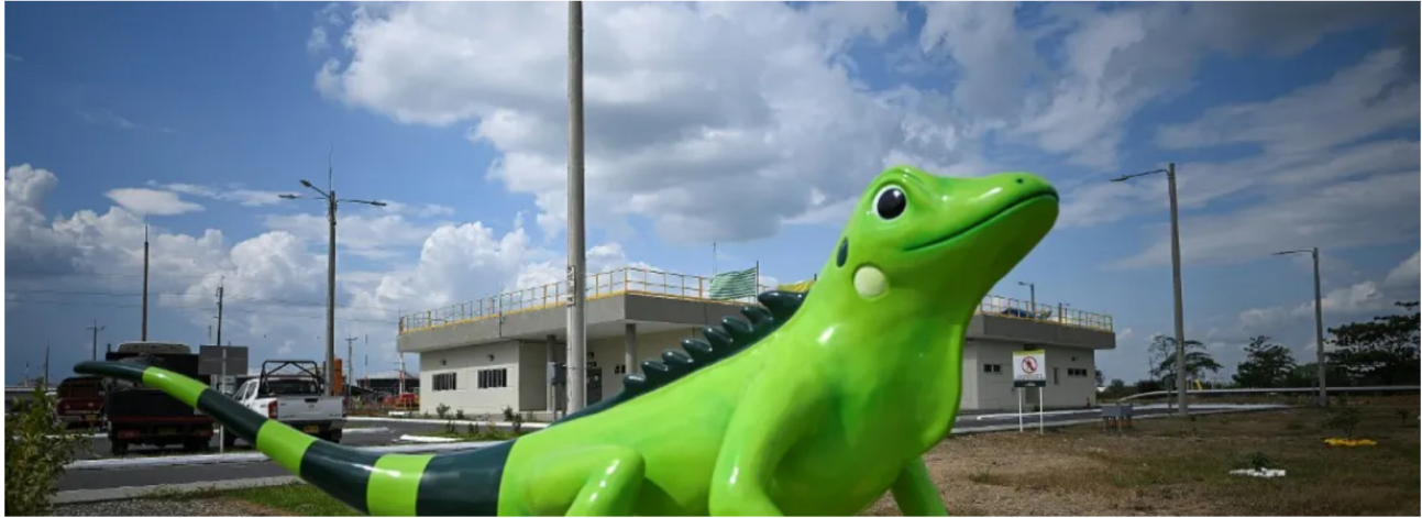
Foto: En materia de hidrógeno verde, Ecopetrol avanza en el proyecto Coral en la Refinería de Cartagena. / AFP.

Compartir en: Facebook f Twitter X Whatsapp