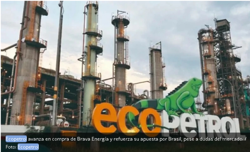
Ecopetrol avanza en compra de Brava Energía y refuerza su apuesta por Brasil, pese a dudas del mercado.

Bogotá - Ecopetrol continúa avanzando en su proceso de expansión internacional con la adquisición de una participación estratégica en Brava Energía, consolidando su interés en el mercado brasileño. Sin embargo, persisten dudas entre analistas e inversionistas sobre la ejecución, el control accionario y el impacto real de la operación.