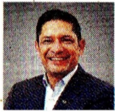
JUAN CARLOS HURTADO PRESIDENTE ENCARGADO DE ECOPETROL

La petrolera estatal publicó su informe de perspectivas para el primer trimestre. Proyecta ingresos entre $27 y $30 billones, lo que implicaría una caída de entre 4,5% y 14% frente a los $31,4 billones registrados en el mismo periodo del año pasado.