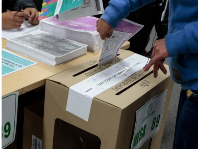
El 31 de mayo se llevarán a cabo las elecciones presidenciales en Colombia, en las que la USO anunció su apoyo a Iván Cepeda