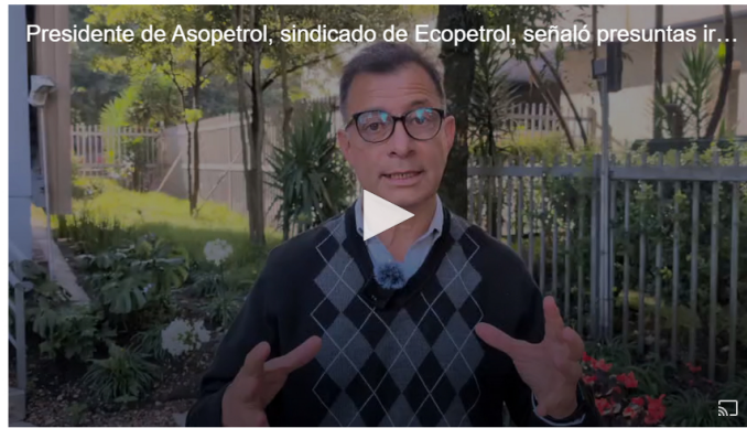
Presidente de Asopetrol, sindicato de Ecopetrol, señaló presuntas ir...

En lo que serían las graves irregularidades financieras al interior de la estatal Ecopetrol, el sindicato Asopetrol, uno de los tres más importantes al interior de la compañía, exigió la devolución inmediata del 2% mensual del salario retenido a más de 8.500 trabajadores no afiliados a la Unión Sindical Obrera (USO), el sindicato mayoritario de la compañía y que se estaría viendo beneficiado por prácticas apartadas de la ley.