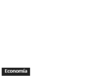
Economía Moody's baja calificación de Ocesa (Ecopetrol) por riesgos