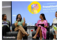
Economía Agro y Crisis Climática: Debate clave para el Futuro Global