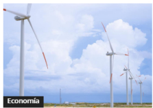
Economía Retraso parques eólicos AES y Ecopetrol en La Guajira