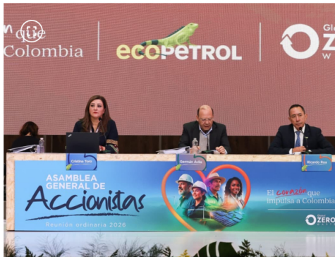
Asamblea de Ecopetrol 2026

Este punto resulta importante en el contexto actual, donde el financiamiento del gasto público y las necesidades de caja de empresas estatales presionan las políticas de dividendos.