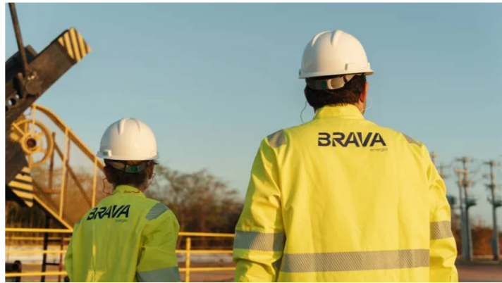
El valor de mercado de Brava es de R$ 9.010 millones.

El anuncio de que la empresa colombiana Ecopetrol ha llegado a un acuerdo para adquirir el 26% de Brava Energía por 2.800 millones de reales y realizará una oferta pública de acciones (OPA) para alcanzar el 51% del capital social de la empresa no ha sido bien recibido por los inversionistas.