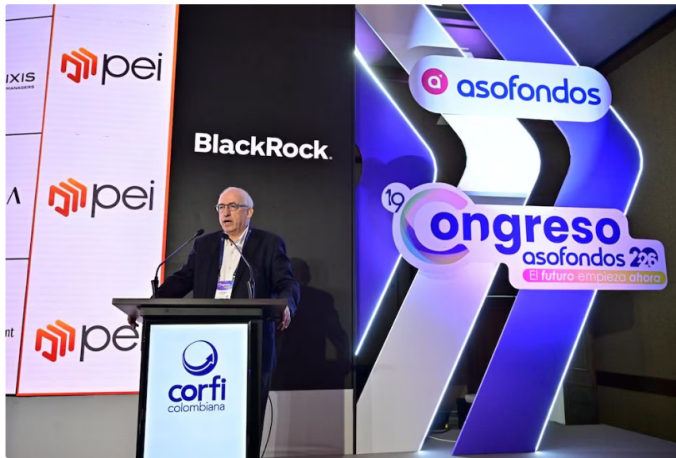
Las utilidades del Banco de la República al Gobierno colombiano superaron por primera vez a las transferidas por Ecopetrol en el último ejercicio fiscal, afirmó el presidente del emisor, Leonardo Villar

Leonardo Villar, gerente del Banco de la República, afirmó que la entidad transfirió al Gobierno colombiano utilidades superiores a las de cualquier otra empresa pública, incluidas Ecopetrol, durante el último año fiscal.