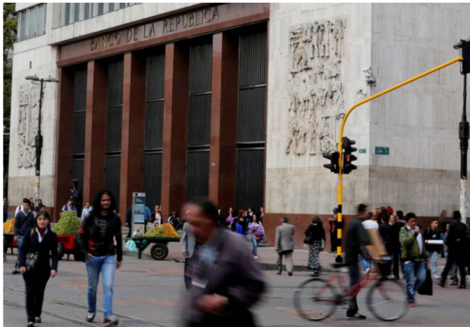
El gerente Leonardo Villar resaltó la excepcional rentabilidad de las inversiones internacionales del Banco de la República como motor de estos ingresos históricos

La utilidad remitida por el Banco de la República al Gobierno no solo superó las de Ecopetrol, sino que también sobresalió respecto de todas las empresas públicas del país. Villar detalló que “esto son utilidades reales que les dimos porque obtuvimos una rentabilidad muy alta con inversiones de portafolio del banco en el exterior” .