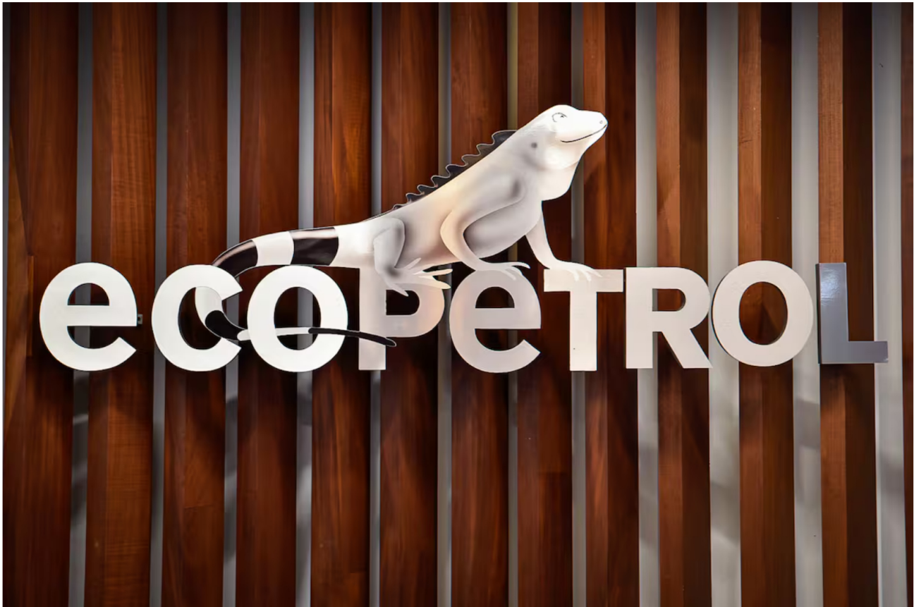
Imagen de referencia del logo de Ecopetrol.

Siga las noticias de El Universal en Google Discover