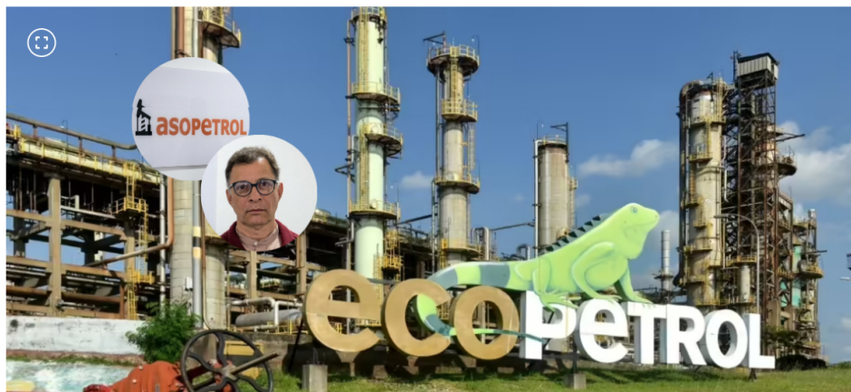
El sindicato exige igualdad y transparencia ante el inicio de las negociaciones entre Ecopetrol y la USO.

Redacción El Tiempo 24.04.2026 09:42 | Actualizado: 24.04.2026 09:42