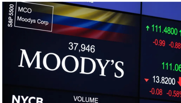
Las razones de Moody's para bajar la calificación de Colombia

Inglés más efectivo con IA y... LCM Idiomas | Insíbete ahora