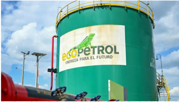
Imagen de un tanque de almacenamiento de petróleo crudo en la planta de la petrolera colombiana Ecopetrol en Acacias, departamento del Meta.

La calificadora se refirió, sin nombrarlo directamente, a la salida 'temporal' de Ricardo Roa de su cargo en medio de sus escándalos judiciales.