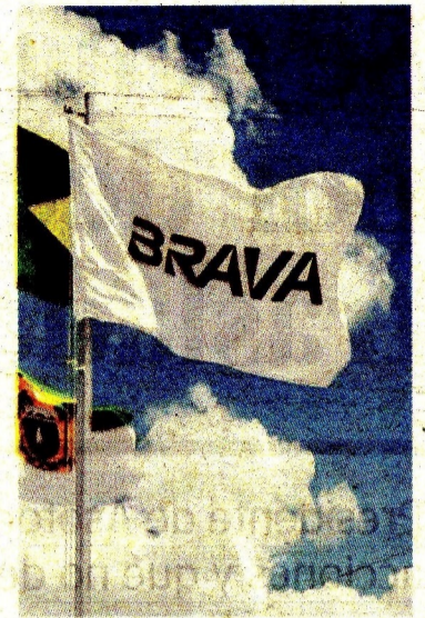
Brava Energía tiene operaciones de crudo y gas.

Defendió los avances en salud pública y atención primaria. Se han desplegado 10.983 equipos básicos, 1.882 proyectos por $4,4 billones y 1.680 vehículos asistenciales para mejorar el acceso en territorios históricamente excluidos, fortaleciendo la red. En materia preventiva, destacó la vacunación contra fiebre amarilla. Se han aplicado más de 5,5 millones de dosis.