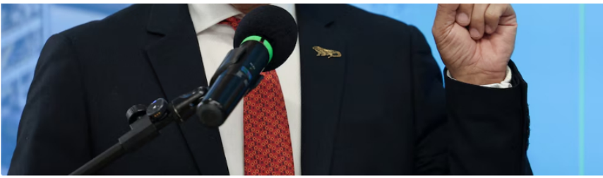
FOTO DE ARCHIVO. El presidente del conglomerado energético colombiano Ecopetrol, Ricardo Roa, habla durante una conferencia de prensa en la sede de la compañía en Bogotá, Colombia, 4 de marzo, 2026.