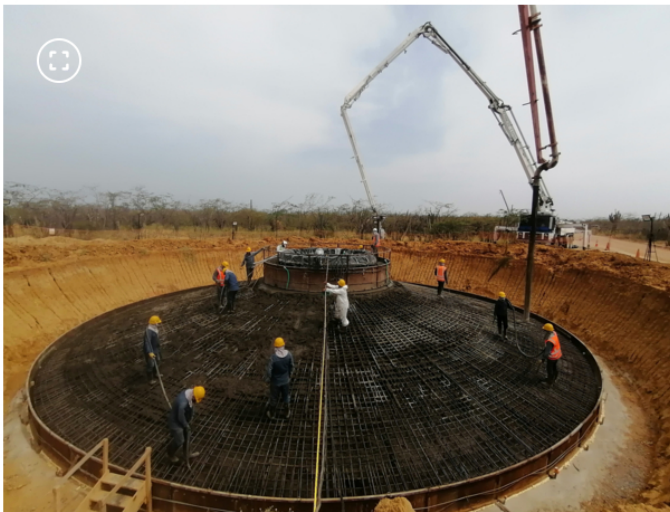
Obras en Windpeshi

El gerente de proyectos de Ecopetrol también manifestó que la empresa ha organizado cuatro jornadas de 'registratón' de proveedores para asegurar que la contratación de bienes y servicios sea local .