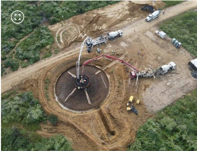
Obras en Windpeshi

Aunque se estima que la ejecución de las obras podría extenderse hasta por dos años , la compañía busca optimizar los cronogramas para que el parque entre en operación comercial en un plazo menor al previsto.