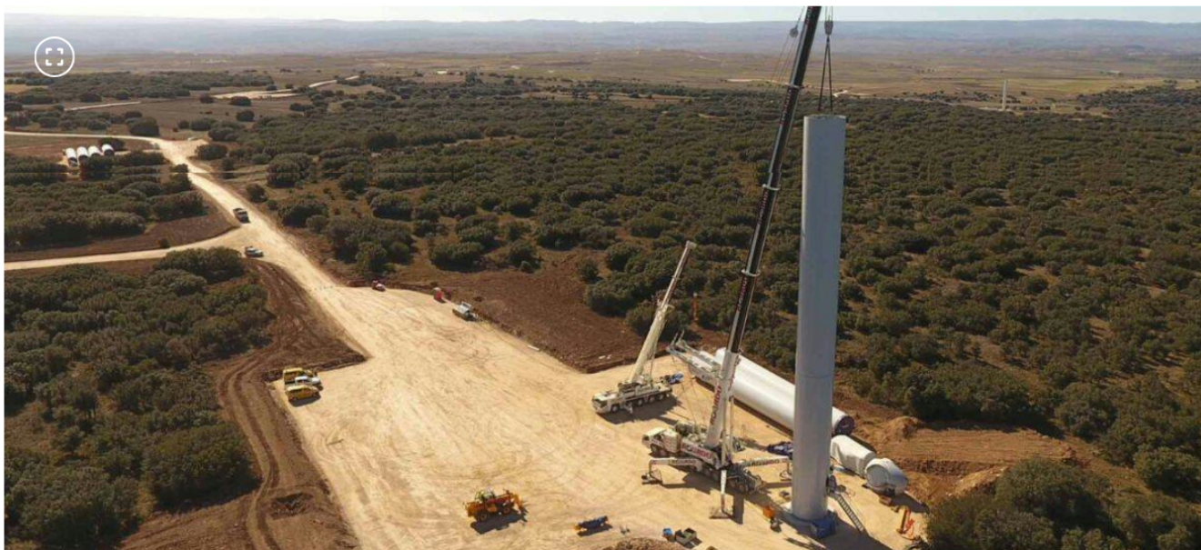
Obras para el Parque Eólico en la Guajira.

Este proyecto está ubicado en jurisdicción de los municipios de Uribia y Maicao. Contará con una capacidad de 205 megavatios.