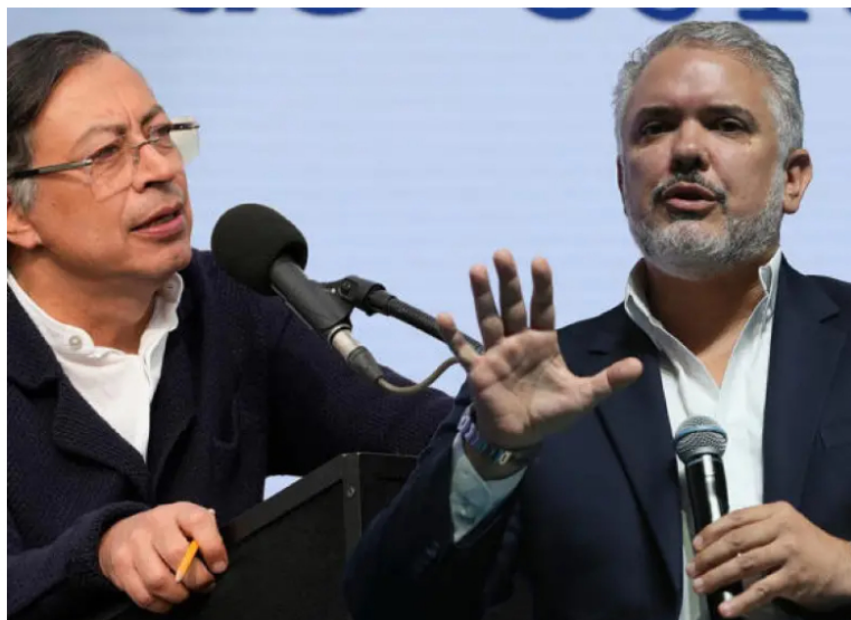
El presidente Petro y el expresidente Duque se enfrentaron en redes sociales por la deuda de Colombia con el FMI.

Gustavo Petro e Iván Duque protagonizan un duro enfrentamiento político tras el pago de la deuda de Colombia con el FMI adquirida en pandemia.