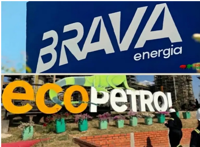
Brava Energía nació en 2024 tras la fusión de 3R Petroleum y Enauta. Actualmente, es la segunda compañía independiente más grande listada en la bolsa de Brasil en términos de reservas y producción.

Ecopetrol acordó comprar el 26% de la brasilera Brava Energía y lanzará una oferta pública para alcanzar el 51% de las acciones. El objetivo es asumir el control operativo de la firma extranjera, consolidando su portafolio en una de las cuencas energéticas más dinámicas de la región.