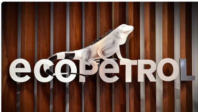
Logo de Ecopetrol , la empresa estatal de hidrocarburos.