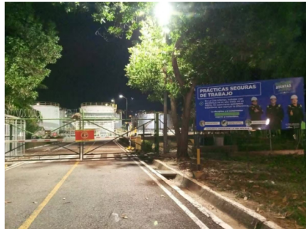
Durante 48 horas comunidades del corregimiento El Centro protestaron para exigir a Ecopetrol que mantenga la inversión en el campo petrolero La Cira Infantas.

Otro aspecto clave del acuerdo es la garantía de no represalias contra quienes participaron en la protesta. Ecopetrol ratificó que no se emprenderán acciones legales ni sanciones contra líderes sociales o trabajadores, reconociendo el carácter pacífico de la movilización y contribuyendo a restablecer la confianza entre las partes.