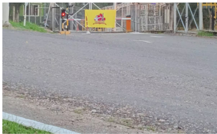
Durante 48 horas comunidades del corregimiento El Centro protestaron para exigir a Ecopetrol que mantenga la inversión en el campo petrolero La Cira Infantas.

A esto se sumó la preocupación por la posible caída en la producción y la paralización de actividades clave como perforación y mantenimiento (workover), lo que generó incertidumbre en la economía local. Las comunidades también señalaron un rezago en inversión social, evidenciado en deficiencias en infraestructura básica como vías, acueducto y servicios educativos.