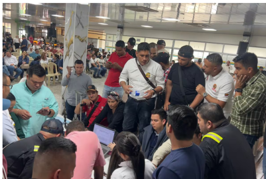
Comunidades y trabajadores del corregimiento El Centro levantaron el bloqueo tras alcanzar un acuerdo con Ecopetrol que garantiza la continuidad operativa en el campo La Cira Infantas.

Siga las noticias de Vanguardia en Google Discover