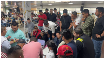
Comunidades y trabajadores del corregimiento El Centro levantaron el bloqueo tras alcanzar un acuerdo con Ecopetrol que garantiza la continuidad operativa en el campo La Cira Infantas.